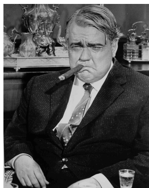
Orson Welles (1915-1985), Scénariste américain et acteur

1984 est un roman philosophique et d'anticipation publié en 1949, dans lequel Orwell dessine un monde totalitaire dans lequel les idéologies ont triomphé de l'individu. À travers ses œuvres, George Orwell y développe certains de ses engagements. Dans ses œuvres, nous pouvons voir sa critique de l'impérialisme et du totalitarisme quel qu'il soit. George Orwell a toujours combattu pour la justice sociale et a soutenu les classes ouvrières afin de lutter contre leurs conditions déplorables.