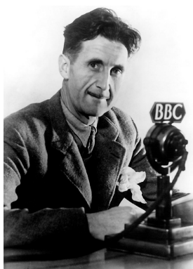
George Orwell (1903-1950), écrivain anglais

Connais-tu les deux personnes ci-dessous? Lis les textes ci-après pour te familiariser avec leur travail.